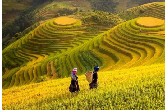
Plantações de arroz em Mu Cang Chai, Vietnã https://www.mundoasiatours.com/pt/tour/aventura-no-vietna/